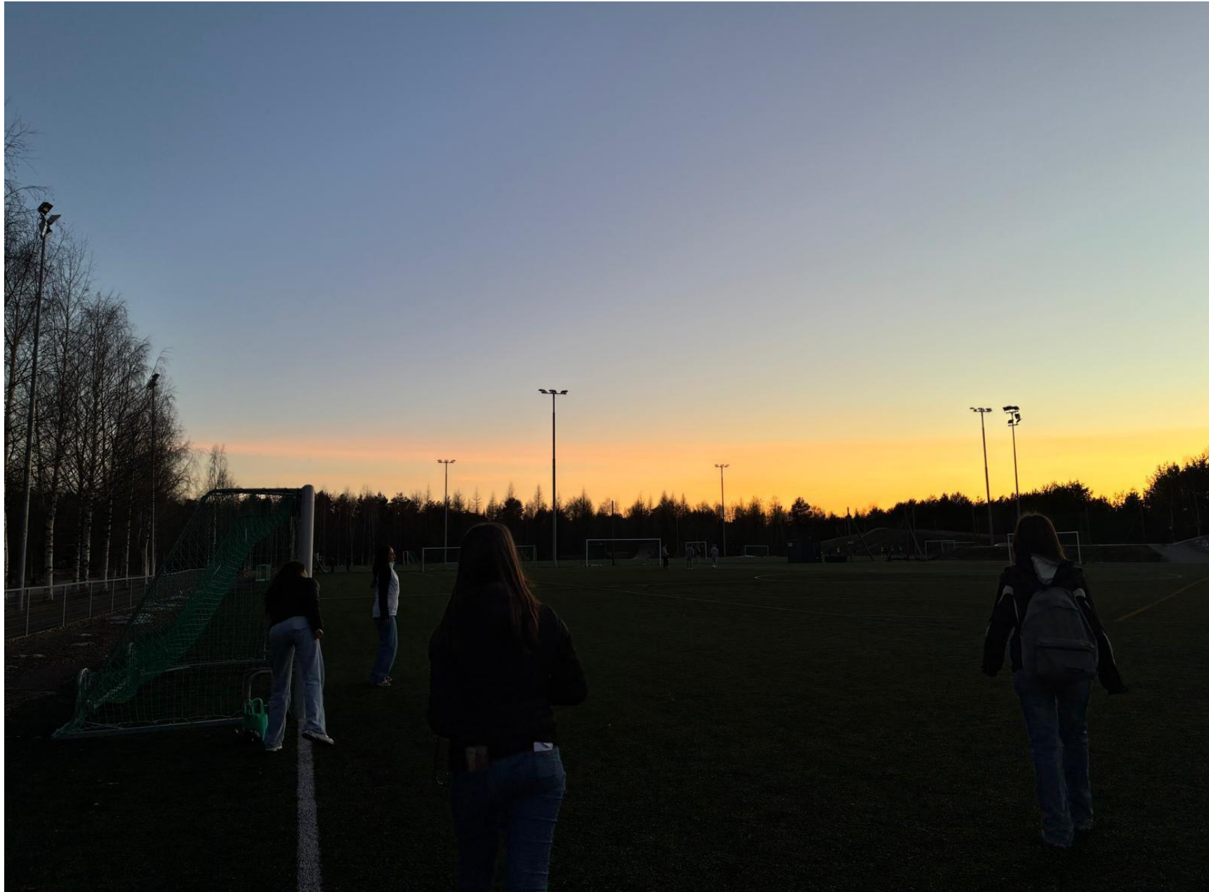
Foto fatta al campo di calcio, ultima partita.

Photo made in the soccer field, the last match.